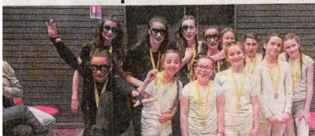
■ Les danseuses unies vers la victoire.